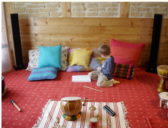
Vue intérieure du cabinet

Il n'existe aucune contre indication à la prescription de la musicothérapie. On la retrouve aujourd'hui dans plus de 400 centres hospitaliers français, de la néo-natologie à la gériatrie, de la chirurgie à la psychiatrie sans oublier la cancérologie et toutes les affections du corps et de l'esprit.